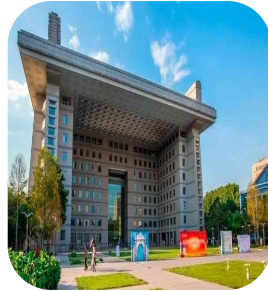
Otras becas (Fellowships, Idiomas, Intercambios, etc.)