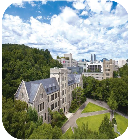
Becas de Universidades Coreanas